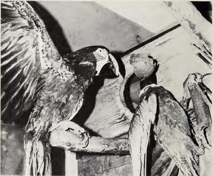
Abb. 3: Spiel mit der Kokosnußschale

Unbekannten Dingen gegenüber, die wir dem Ara-♂ anboten, verhielt es sich ängstlich. Es überließ dem zahmen und nicht mißtrauischen ♀ das Abnehmen und prüfende Betasten, und darauf bedrängte er seine Partnerin, ihm den Gegenstand zu überlassen. Einfach dem anderen das Spielzeug wegreißen, gab es bei den Aras so wenig wie bei den Keas (Keller 1975). Durch die aufdringliche Hartnäckigkeit gelangte er aber meistens sehr schnell zum Ziel. Von Kokosnußschalen trennte sich das ♀ nicht so leicht. Nach vielen vergeblichen Annäherungsversuchen zeigte das ♂ eine Serie von Imponierbewegungen und äußerte dazugehörige Rufe, auf die seine Partnerin überhaupt nicht reagierte. Sie wehrte ihn mit Fußtritten oder Schnabelschlägen ab, und schließlich schlug sie ihm mit der Kokosnußschale über den Schnabel. Wenn dann das ♂ dieses Spielzeug endlich erwischt hatte, wurde es ihm nach einiger Zeit über, und nun versuchte er das ♀ anzuregen, sich von neuem dafür zu interessieren (Abb. 3). Er rückte dicht an seine Partnerin heran und schwenkte den Gegenstand (die Kokosnuß-